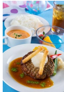
「廣場樓閣餐廳」 特別套餐 1,940 日圓