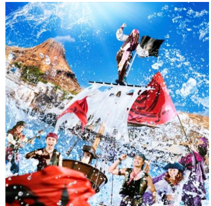
東京迪士尼海洋 「迪士尼夏日海盜世界」

於娛樂表演「 海盜烈夏交鋒：溼不可擋！ 」中，傑克船長的宿敵巴博沙船長將會率領旗下海盜占據地中海港灣，並與傑克船長一較高下。屆時，遊客將會成為巴博沙船長招募的海盜新兵，體驗趣味十足的菜鳥入門訓練，並同時目睹震撼迫人的海盜船爭奪戰、熱鬧盛大的海盜宴會，在滂湃飛瀑的大量水花中盡興度過沁涼透頂的娛樂時光。