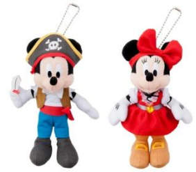
玩偶別針 1,700 日圓 銷售地點：恩波利歐商場