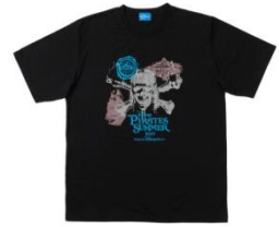
T 恤 1,700 日圓 銷售地點：恩波利歐商場