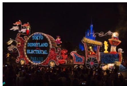
東京迪士尼樂園 電子大遊行~夢之光

迪士尼飯店、迪士尼度假區線、伊克斯皮兒莉等設施亦會準備多樣充滿夏日特色、適合全家同歡的節目內容。在晴空萬里的夏季，歡迎遊客與家人、朋友相偕蒞臨東京迪士尼度假區，與迪士尼明星一同在此度過美好難忘的活潑假期。