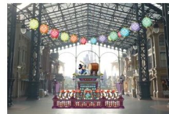
照相景點 (世界市集)

美妮與黛絲吹奏竹笛、唐老鴨與高飛敲打太鼓的節慶景象，亦將化為照相景點在灰娘城堡前的圓環登場。歡迎遊客前來發揮創意，拍攝出彷彿正與迪士尼明星一同吹笛、擊鼓的精采紀念照。