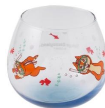
玻璃杯 900 日圓 銷售地點：格蘭恩波商場