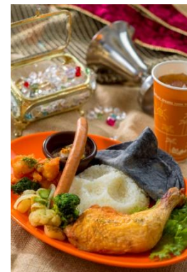
「米格勒黃金國快餐中心」 特別套餐 1,580 日圓

地中海港灣將會掛起骷髏頭海盜旗等主題裝飾，並撐起黑色及紅色的遮陽傘，營造海盜世界氛圍。港灣多處亦會設置照相景點，供遊客在此拍攝如同登上了海盜船或是被囚禁在監獄中的趣味紀念照。