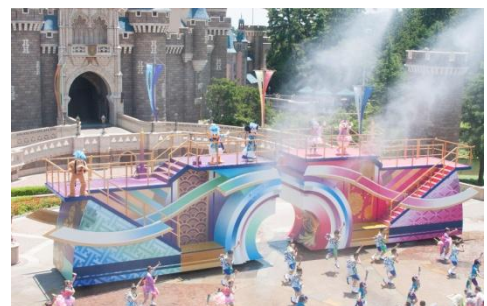
東京迪士尼樂園 「迪士尼和風夏慶」

全新娛樂表演「 水花燦燦！盛夏節奏 」將於灰姑娘城堡前的圓環全域熱鬧上演。米奇等迪士尼明星將身穿全新服飾登場，邀請遊客一同隨著以日本傳統樂器演奏的迪士尼樂曲歡呼、拍掌，享受嗨翻天的慶典氣氛。米奇們搭乘的花車也將噴灑大量清涼水花，將遊客淋成歡樂無比的落湯雞。