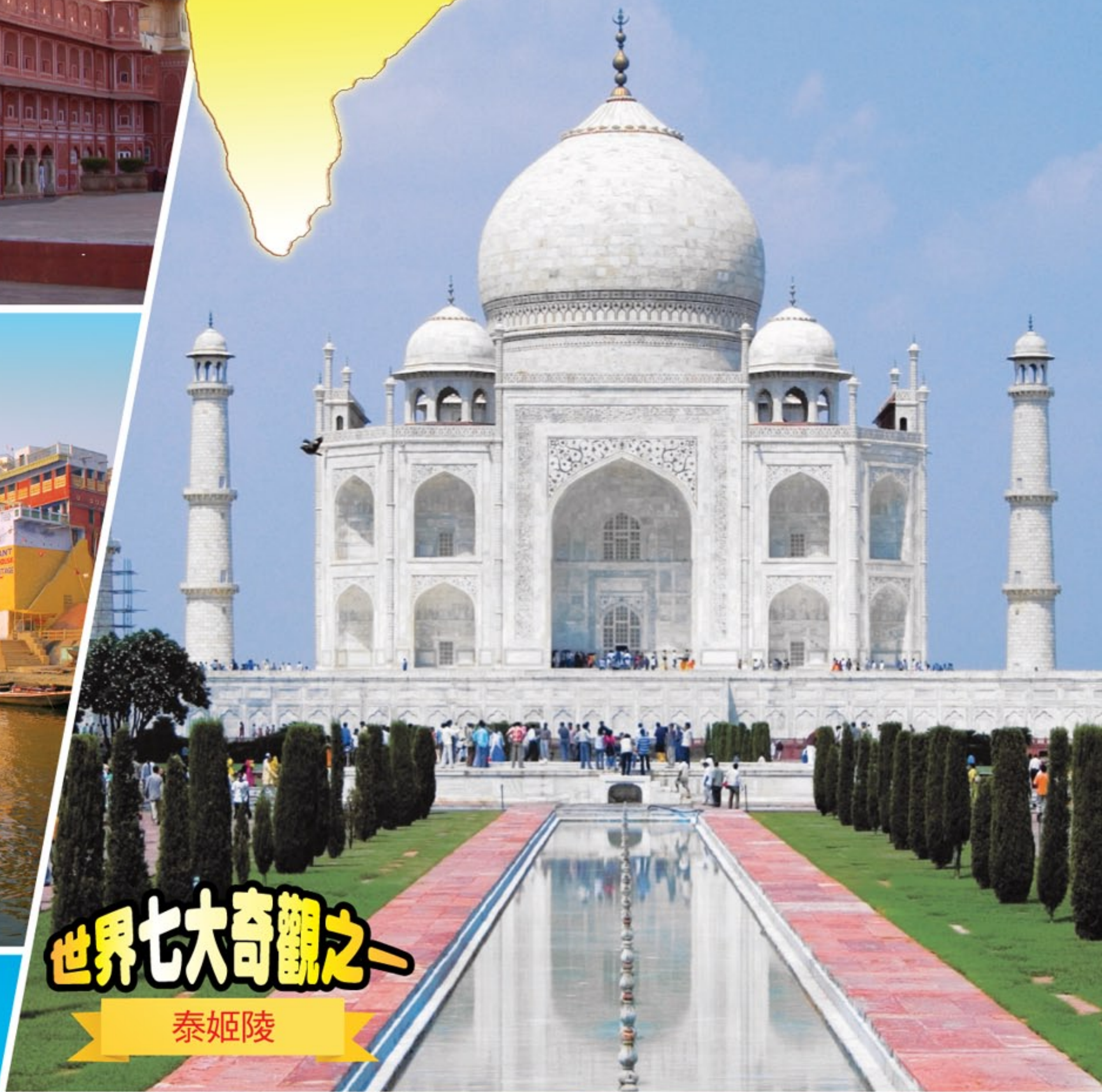
世界七大奇觀之一