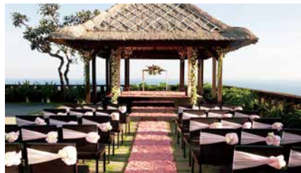
Pavillion Wedding以峇里式草屋取代玻璃教堂，感覺平實而溫馨。

Bulgari Bali因楊冪及劉愷威而廣為人知，而據傳鄭秀文及許志安也在此秘婚。藝人也熱捧，就知道Bulgari有過人之處。這裡沒有豪華玻璃教堂，但氣氛私密，優雅庭園配上無敵海景，是舉行溫馨家庭式婚禮的最佳場地。