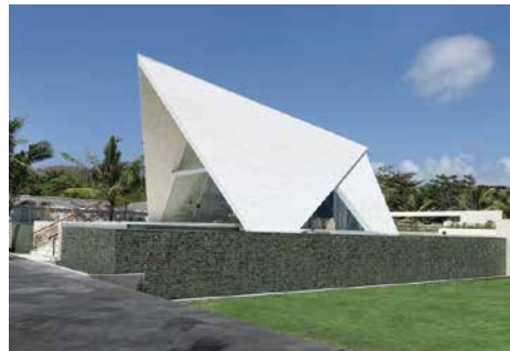
教堂外環境優美，充滿翠綠，與沙灘亦只有數步距離。