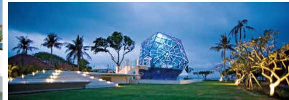
夜色中的鑽石教堂，在峇里海邊散發動人光芒。