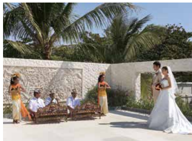
可安排現場峇里樂器演奏，增添異國氣息。

2013年末才正式啟用的Ulu Shanti，位於Nusa Dua區頂級度假酒店The Royal Santrian內，可容納24名賓客。獨特的三角外形，潔白的牆身與落地玻璃設計，盡收背後Tanjung Bena灣蔚藍海景，還能遠眺彼岸的離島及聖山Agung，令氣氛更添神聖。