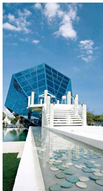
教堂被晶瑩剔透的水池包圍，脫俗高雅。

地址：Sanur Beach, Sanur 網址： www.thediamondbali.com