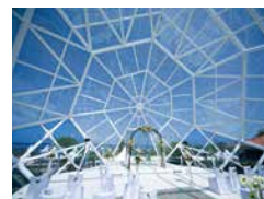
教堂由白鋼筋及天藍色玻璃組成，可容納60位賓客。

不少女士都希望收到鑽石結婚戒指，如果連婚禮也在鑽石裡面舉行，會不會完美得有點超現實？The Diamond Bali就像一顆巨型鑽石，高15米，經548天搭建而成。教堂面向Sanur白色沙灘及園林景色，環境優美，難怪被譽為全球最漂亮教堂之一。