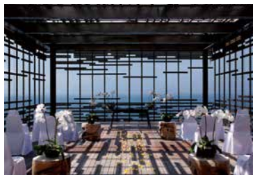
建築設計非常前衛。

Alila Uluwatu是個與眾不同的型格婚禮場地，找來獲獎無數的新加坡建築團隊WOHA設計，以循環再用的木條及電線杆建構而成，環保又有型。在崖邊懸空的Sunset Cabana舉行婚禮，就像在世界盡頭般浪漫。