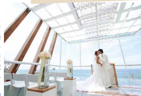
透明以玻璃、白色大理石及茶木建成，洋溢聖潔氛圍。

地址：Anantara Bali Uluwatu Resort & Spa, Uluwatu 網址： bali-uluwatu.anantara.com/wedding.aspx