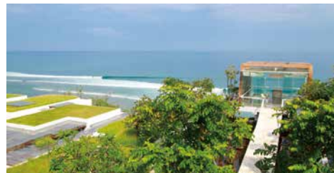
教堂位處崖上，猶如翱翔於天際。

教堂位於30米高的崖上，全玻璃外牆，猶如懸浮於空中的水晶屋。新娘步上長8米的聖潔之路，在盡頭迎接的，除了最愛的一半，還有印度洋與南半球天際融為一體、廣闊無邊的海平面。另外教堂可舉行sunset wedding，試想像在橙紅色的天空下，另一半向你說出「我願意」，一定終身難忘。