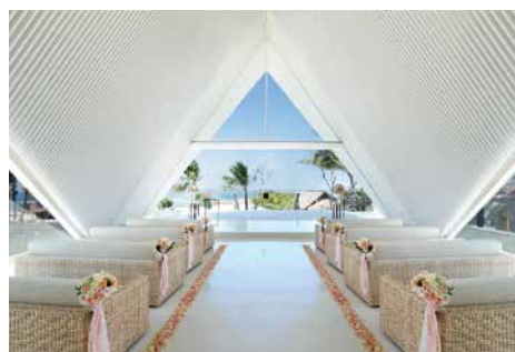
簡約潔白的教堂內部，莊嚴高貴。