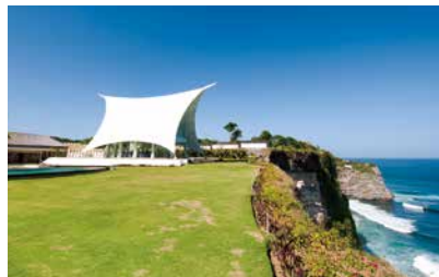
Ritual Chapel的地理位置，完美演繹何謂「山盟海誓」。

位處Uluwatu的懸崖上，三角帆船般的教堂，建築糅合摩登與傳統峇里風格。落地玻璃窗讓大量自然光進內，加上全白大理石地板折射，更添純潔空間感。在此地舉行婚禮，可要求加入峇里印度教祝福儀式，別具意義。