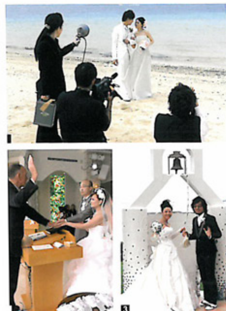
當地攝影師拍攝得非常認真和專業。1可以說是婚禮的重要一刻，在神的見證下互相宣誓。2搖搖樂結婚之鐘，出結婚鐘聲來祝福結婚的人。

這隊結婚團其實早於8/10已從香港出發至沖繩，讓新人們能有充足的時間在當地充電，整妝待發以愉快的心情來迎接大日子的來臨。當日新娘子早上化妝後，便由專業的日籍攝影師帶領他們到酒店旁邊的沙灘上拍攝婚紗照。由於這次集體婚禮對沖繩來說是首次舉行的，在拍攝中途，更吸引了當地的電視傳媒前來採訪。拍攝過後，便開始於小教堂進行神聖的結婚儀式。