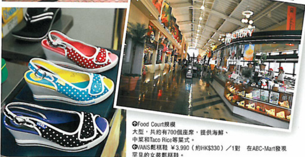
☉Food Court規模大型，共約有700個座席，提供海鮮、中菜和Taco Rice等菜式。 ☉VANS鬆糕鞋 ¥3,990 (約HK$330) / 1對 在ABC-Mart發現罕見的女裝鬆糕鞋。