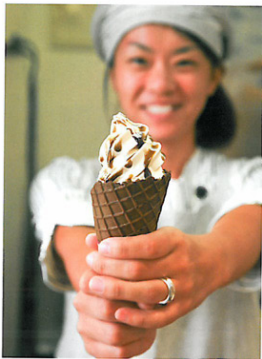
☉黑糖軟雪糕 ¥350 (約HK$30) 黑糖味軟雪糕上淋上黑糖糖漿，蔗糖味清甜。

去Outlet已經成為遊日本的指定動作，來到沖繩南部，不妨去離機場15分鐘車程的Outlet 沖繩暢貨中心 Ashibinaa作最後衝刺，買平貨。除了有Coach、BROOKS BROTHER等知名名牌之外，還有獨家代理幾個沖繩品牌，例如黑糖甜品專門店的KOKUTO-KANASA，其黑糖蛋糕和黑糖軟雪糕，入口微甜卻保留蔗糖的香味，多番被日本飲食節目激讚。