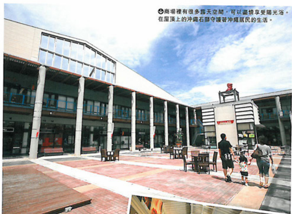
☉商場裡有很多露天空間，可以盡情享受陽光浴。在屋頂上的沖繩石獅守護著沖繩居民的生活。

☉沖繩縣豐見城市豐崎1-1888 ☉商店10:00~20:00，食肆10:00~20:30 (LO20:00) ☉交由那霸國際機場搭免費巴士即抵 ☉www.ashibinaa.com ※以下貨品，售完即止