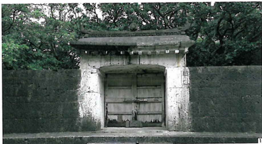
1 城內還保留了很多有歷史價值的建築物。2 首里城入口的牌坊，便是2,000日圓紙幣上的圖樣。

地址：那霸市山王金城町1-1 電話：(81)98-886-2020 開放時間：全年無休 3~11月，9:00~18:00 12~2月，9:00~17:30 門票：成人¥800/約HK$75.2，兒童300/約HK$28.2。