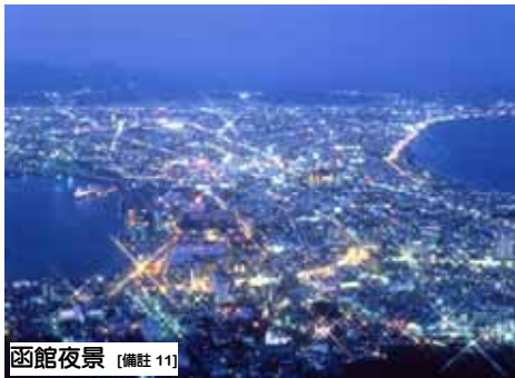
函館夜景 [備註 11]