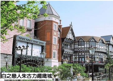
白之戀人朱古力趣緻城