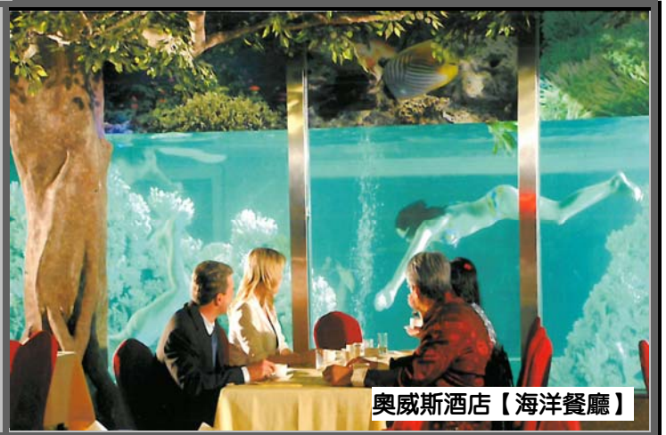
奧威斯酒店【海洋餐廳】