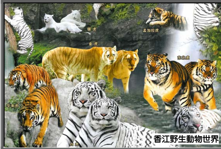
香江野生動物世界

「海洋餐廳」享用自助晚餐【生蠔、刺身、各式海鮮、中西美食及甜品】 【欣賞美人魚表演】、觀光船遊七星岩景區諸葛八卦村、番禺香江野生動物園 【百虎園】、丹頂鶴濕地公園、《福祿金陵鵝風味宴》(直航船來回) 3 天團