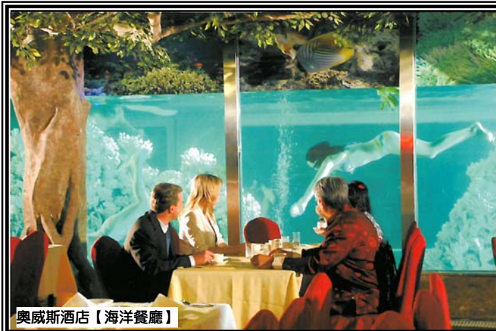
奧威斯酒店【海洋餐廳】