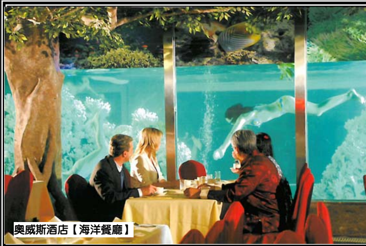
奧威斯酒店【海洋餐廳】

「海洋餐廳」享用自助晚餐【生蠔、刺身、各式海鮮、中西美食及甜品】 【欣賞美人魚表演】、《福祿金陵鵝風味宴》(直航船來回) 2 天團