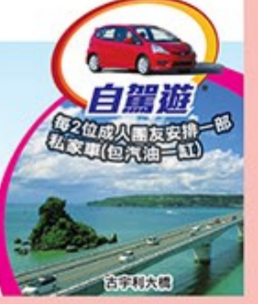
自駕遊 每2位成人需友安排一部私家車(包汽油一缸)