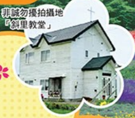
非誠勿擾拍攝地 「斜里教堂」