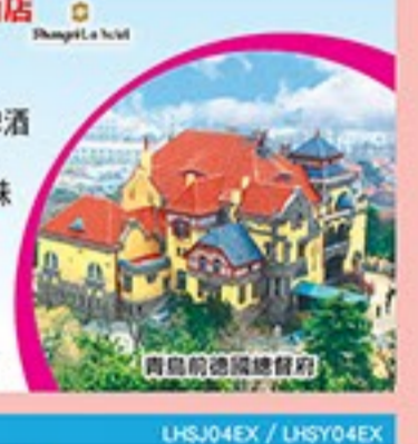
青島前德國總督府