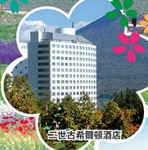
三世古希爾頓酒店