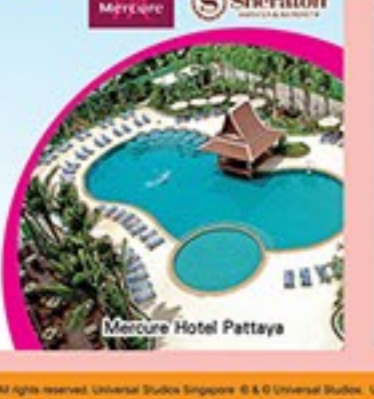
Mercure Hotel Pattaya