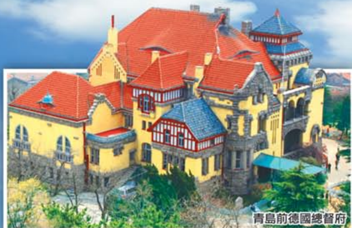
青島前德國總督府