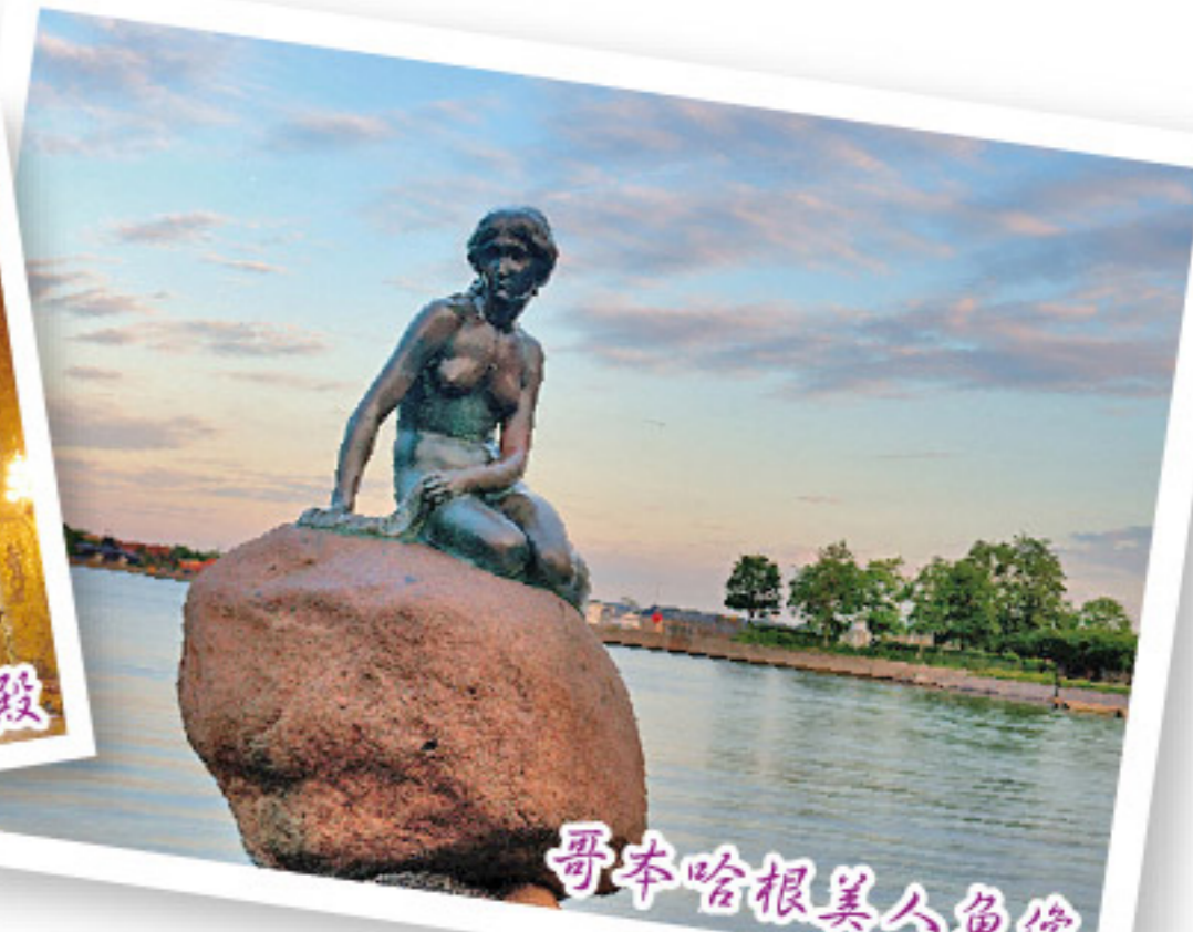
哥本哈根美人魚像

崇尚簡約自然與時尚感的北歐，生活悠閒又具備文化趣味，其設計風格更蔚為世界風潮，難怪各大名城都榮登全球最佳生活品質城市之列。來訪這片清新之地，感受另一番獨特風情！