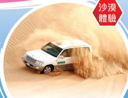
四驅車沙漠之旅 Desert Safari