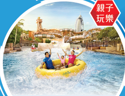
瘋狂維迪水上樂園 Wild Wadi Water Park