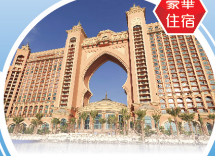
亞特蘭蒂斯酒店 Atlantis The Palm