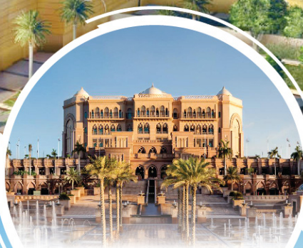
阿聯酋皇宮酒店 Emirates Palace