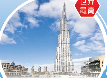
哈里發塔 Burj Khalifa