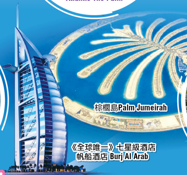
棕櫚島 Palm Jumeirah