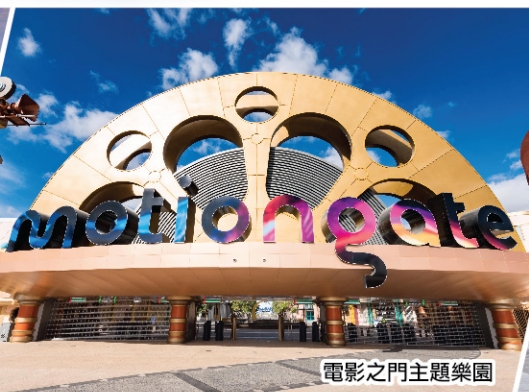
電影之門主題樂園