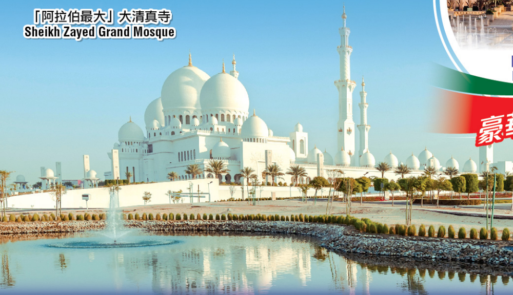
「阿拉伯最大」大清真寺 Sheikh Zayed Grand Mosque