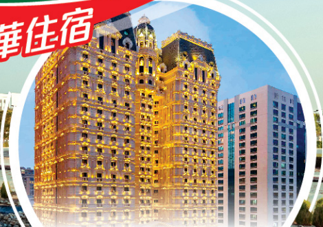
皇家玫瑰酒店 Royal Rose Hotel