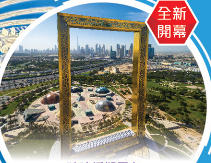
玻璃橋觀景台 「杜拜相框」 Dubai Frame