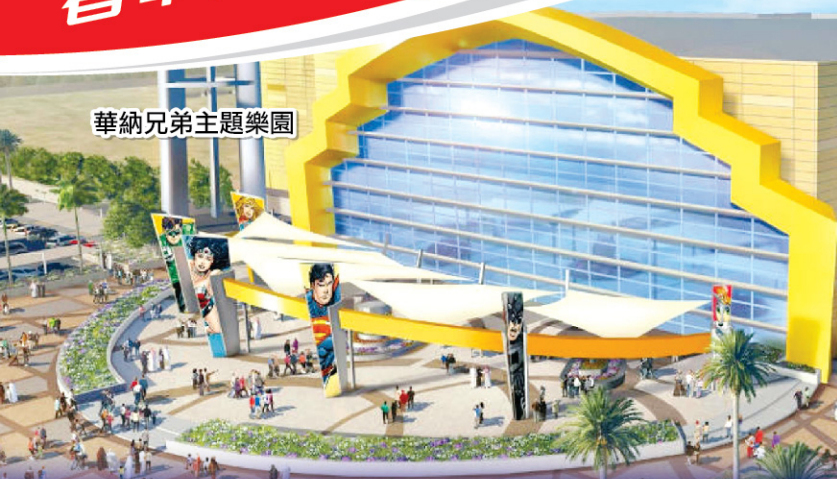
華納兄弟主題樂園