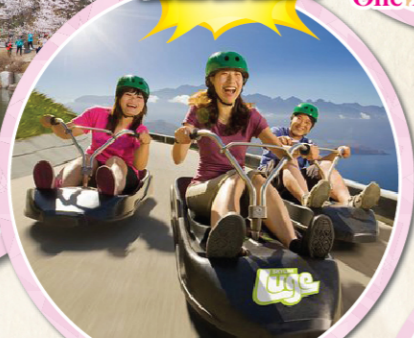
統營 (Skyline) Luge 滑行車