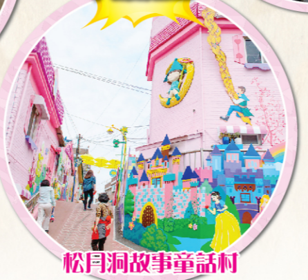
松月洞故事童話村