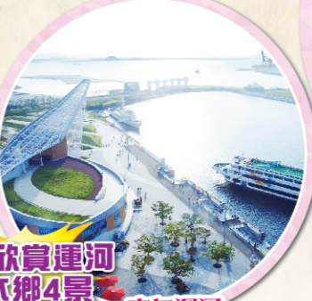
沿途欣賞運河之水鄉4景